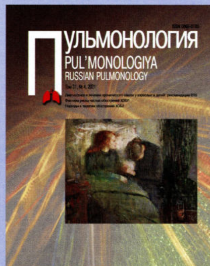
Edvard Munch, 1886. "The Sick Child". National Gallery, Oslo (Norway)