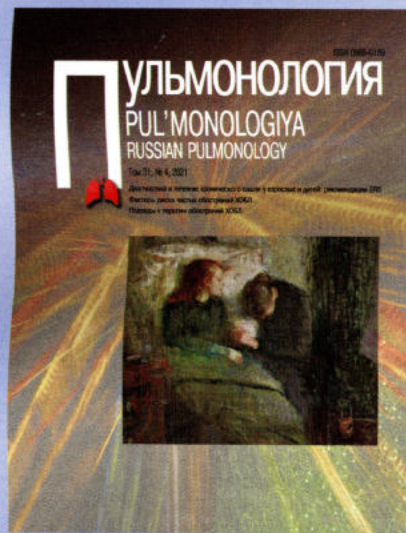
Эдвард Мунк (1886). «Больная девочка». Национальная галерея, Осло (Норвегия)